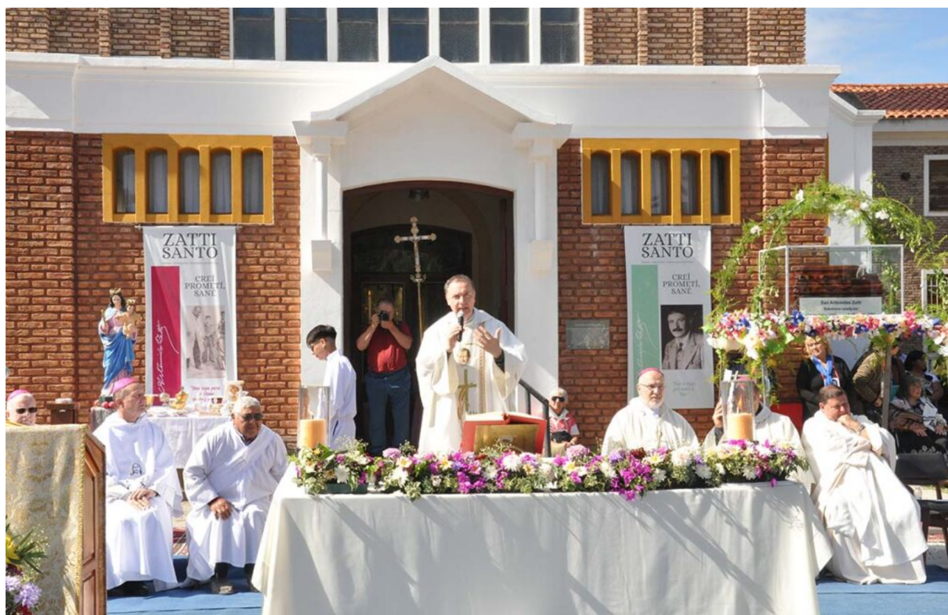
Viedma, Argentyna – marzec 2023 r.

Wizyty Przełożonego Generalnego nie kojarzą się jedynie z wydarzeniem typu „przyjechał i pojechał” lub celebracją ważnych wydarzeń. Jego obecność jest często efektem prośby domów salezjańskich lub inspektorii, aby uczcić jakieś znaczące wydarzenie w ich historii, takie jak 100. lub 50. rocznica powstania, rozpoczęcie nowego dzieła, profesja ślubów zakonnych lub święcenia kapłańskie współbraci, upamiętnienie postaci salezjańskich, które są przykładem dla różnych krajów i dla całego Kościoła. Jednakże intencja świętowania jest jedynie częścią spotkania bogatego w treści i rozmowy dotyczące stanu zdrowia charyzmatu salezjańskiego w skali lokalnej.