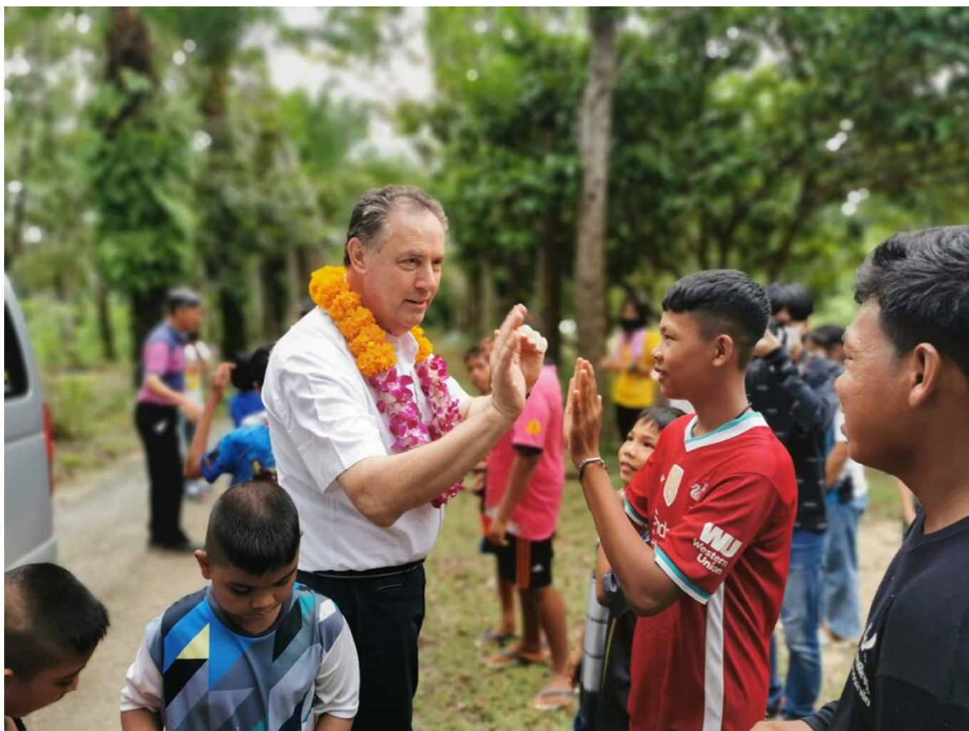
Tajlandia - maj 2022 r.

Tu i ówdzie w kręgach salezjańskich (i wśród młodych ludzi, którzy do nich uczęszczają) można dostrzec większe zainteresowanie zaangażowaniem politycznym , rozumianym w szerokim sensie, jako wkład w osiągnięcie bardziej ludzkiego, bardziej równego, bardziej zintegrowanego społeczeństwa. To właśnie zagadnienie pojawiło się w szczególności podczas wizyty Przełożonego Generalnego w Peru i Stanach Zjednoczonych, gdzie kwestia edukacyjna i wolontariat społeczny są z pewnością uważane przez młodych ludzi za działania przed-polityczne, ale które w coraz większym stopniu muszą być rozumiane jako zaangażowanie na rzecz sprawiedliwości społecznej, zmniejszania nierówności, umożliwienia każdemu godnego życia. Dewiza księdza Bosko, by wychowywać młodych ludzi do „bycia dobrymi chrześcijanami i uczciwymi obywatelami”, nabiera tutaj nowego znaczenia, bardziej zgodnego z wrażliwością i wyzwaniem dzisiejszych czasów.