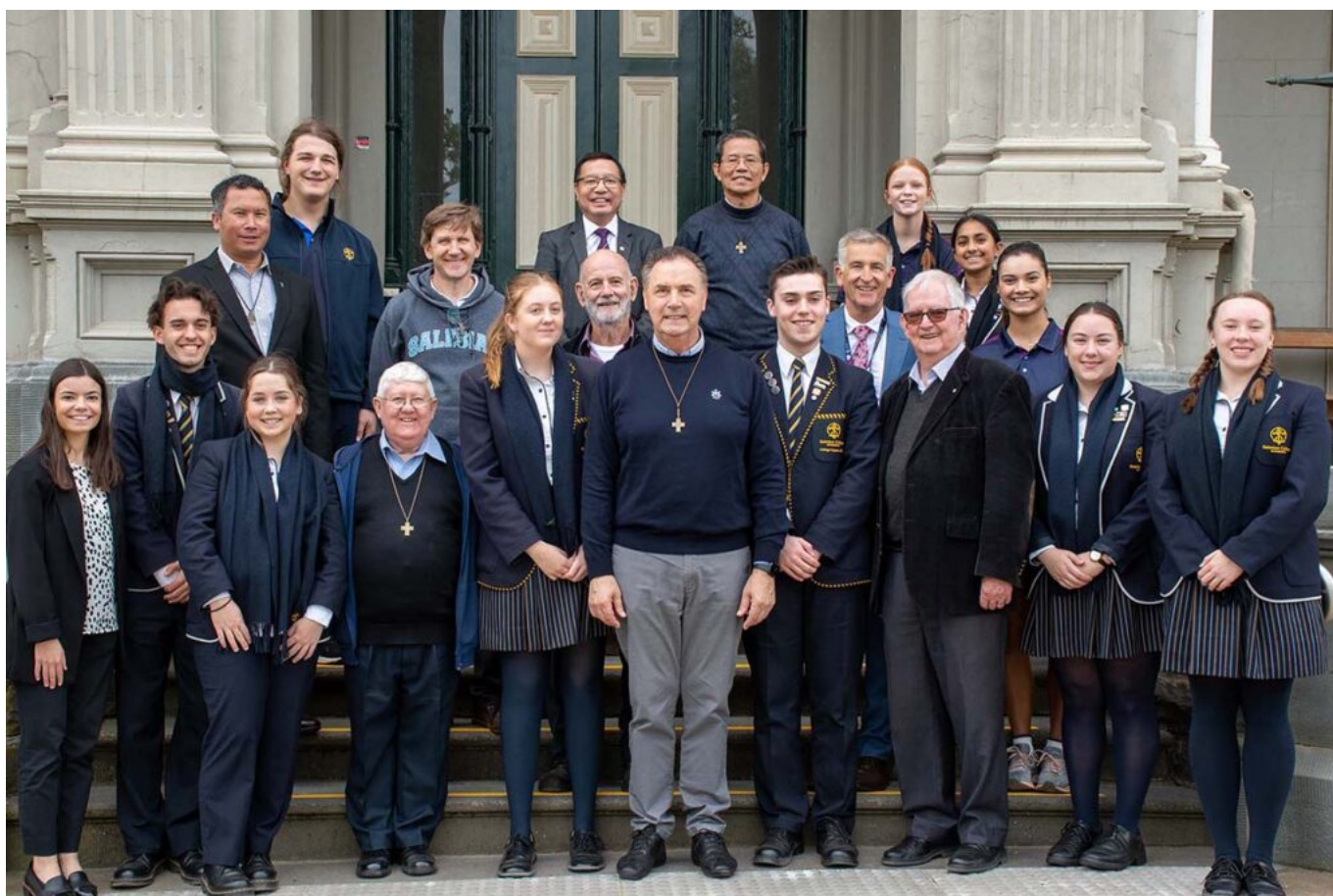
Australia – kwiecień 2023 r.

Sprawozdania z wizyt Przełożonego Generalnego w domach salezjańskich na całym świecie są pełne tych apeli. Przede wszystkim wierzyć w młodych ludzi, być wiernym młodym ludziom , ufać w ich potencjał, przekazywać zaufanie; co oznacza brak uprzedzeń wobec nich, towarzyszenie im z empatią na ich drodze, wspieranie ich w trudnych chwilach, dzielenie się wartościami i inspirowanie wolności. Wezwanie do zaufania obejmuje zobowiązanie do ożywienia marzeń młodych ludzi , aby ponownie zaczęli myśleć z rozmachem, a nie żyć z podciętymi skrzydłami; to ostrzeżenie wydaje się wybrzmiewać mocniej w stronę nowych pokoleń w „dojrzałych” społeczeństwach (jak na Zachodzie), niż w stronę młodych w krajach wschodzących.