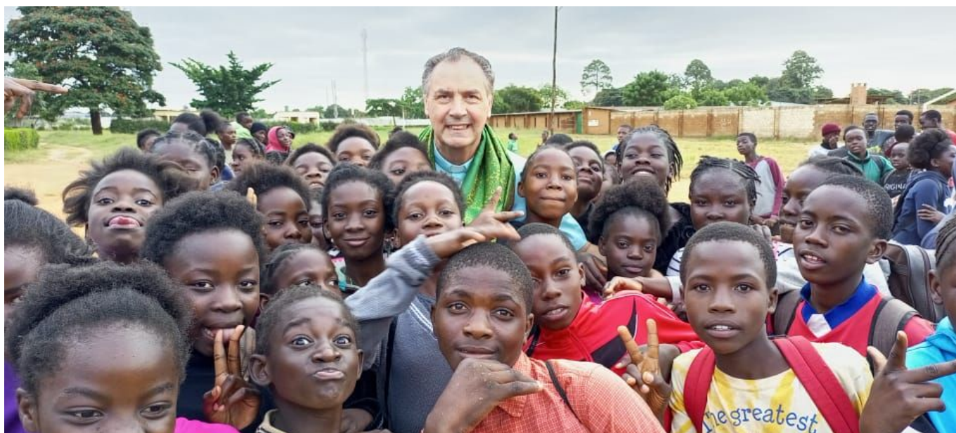
Zambia - kwiecień 2022 r.

Na każdej szerokości geograficznej domy salezjańskie goszczą młodych ludzi z różnych kultur, często różnych religii i grup etnicznych; ponieważ charyzmat Księdza Bosko (choć zrodzony w określonym kontekście kulturowym i religijnym) nie zna granic wyznaniowych, otwiera się także tych, którzy żyją i wierzą inaczej. W ten sposób wielokulturowość charakteryzuje obecnie wiele środowisk salezjańskich (oratoriów i szkół) w Europie i Ameryce Północnej, a także jest cechą konstytutywną dzieł synów księdza Bosko w Azji, Afryce i Ameryce Łacińskiej.